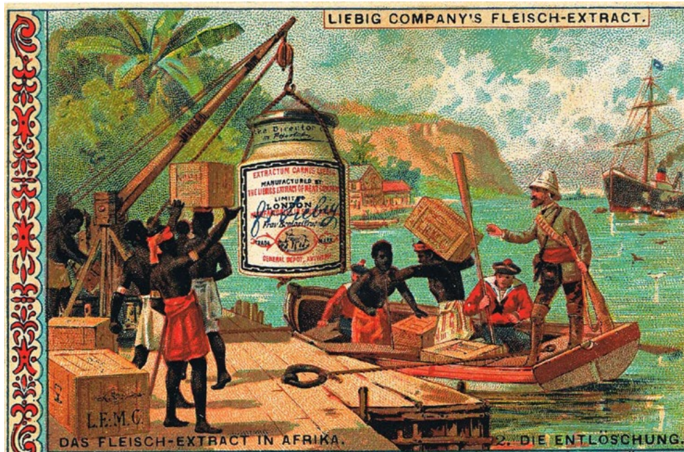
Bild 1 „Das Fleisch-Extract in Afrika. Die Entlöschung“ Liebig Company's Fleisch-Extract, 1891, Zeller S. 228