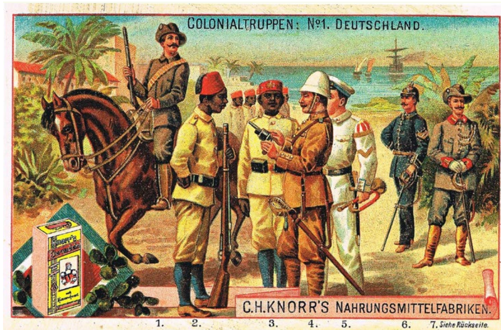
Bild 3 „Colonialtruppen: No. 1. Deutschland“ C.H. Knorr's Nahrungsmittelfabriken, um 1910, Zeller S. 46