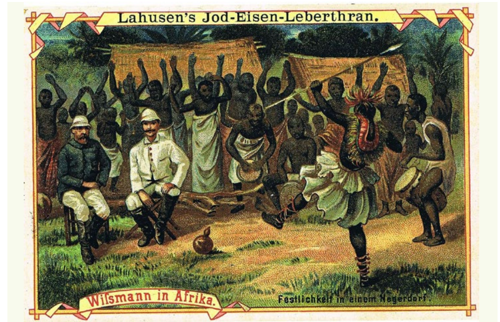
Bild 4 „Wissmann in Afrika“ Lahusen's Jod-Eisen-Leberthran, um 1910, Zeller S. 58