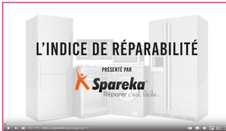
Video: L'indice de réparabilité (français) (französischer Ton)

Regardez la vidéo et répondez aux questions 1 à 7.